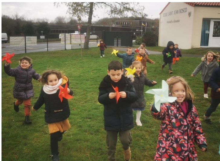
Travail autour de l'air