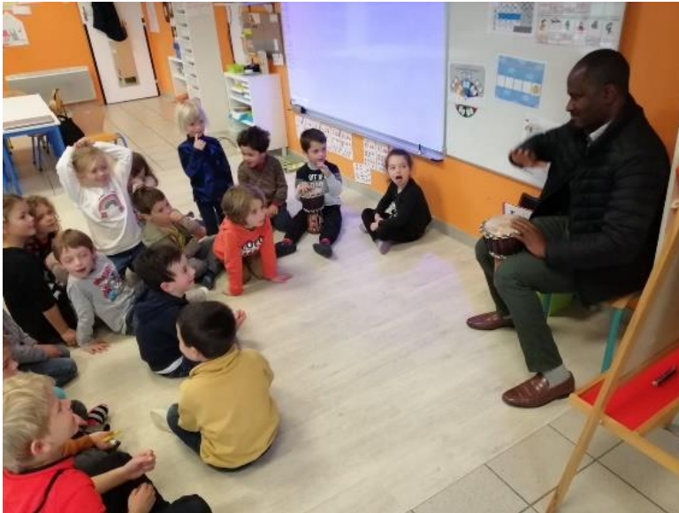
Bol de riz pour une association

Psaume 132.1 : “Oui, il est bon, il est doux pour des frères de vivre ensemble et d’être unis.”