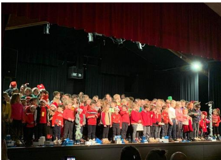
L'arbre de Noël

Ancien testament, livre des proverbes, 24.04 : “avec du savoir-faire on remplit les pièces de mille biens précieux et beaux.”