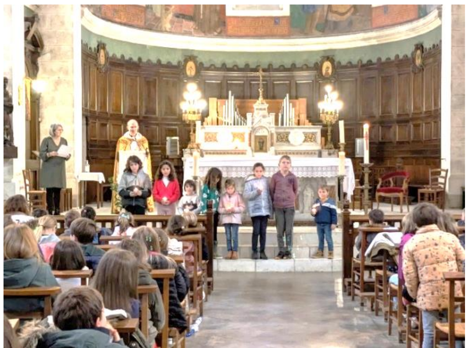
Célébration de Pâques