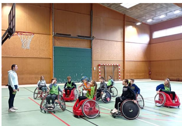
Semaine de la différence

Nous nous engageons à accueillir chacun dans le respect de ses croyances, créant ainsi un environnement inclusif et tolérant.