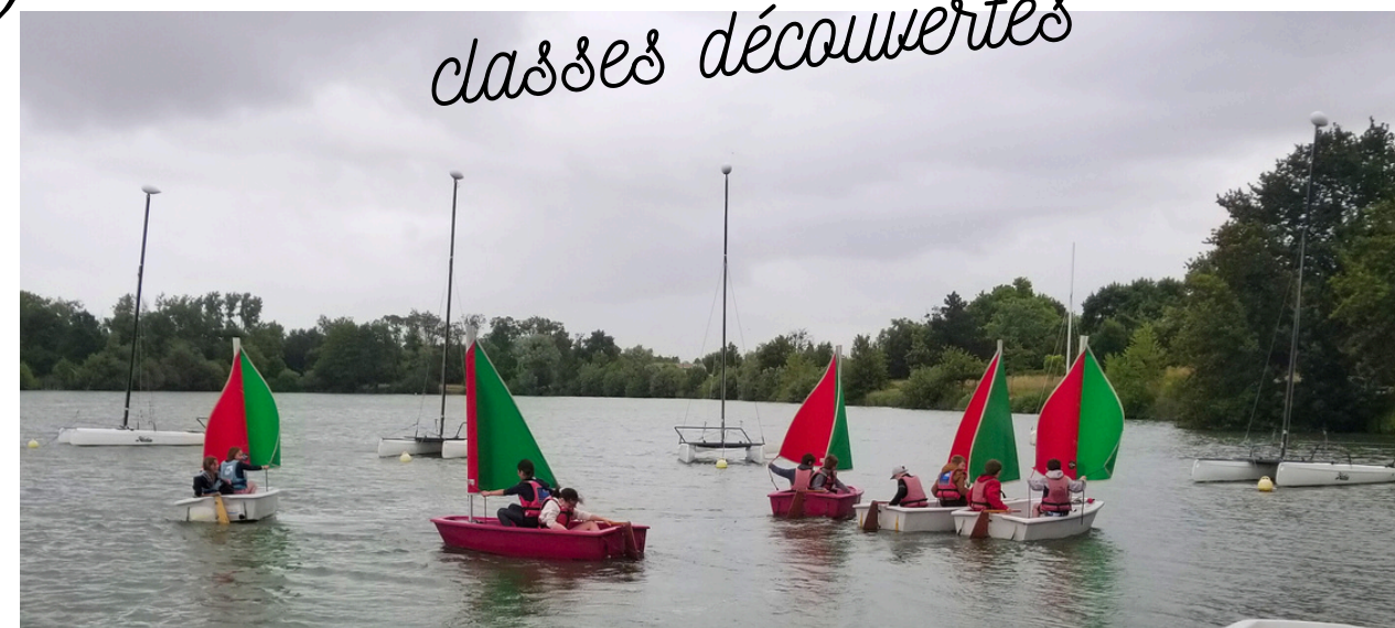
Financement sorties scolaires et classes découvertes