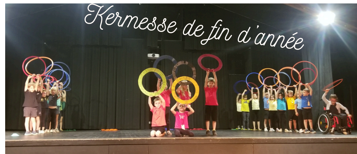
Kermesse de fin d'année