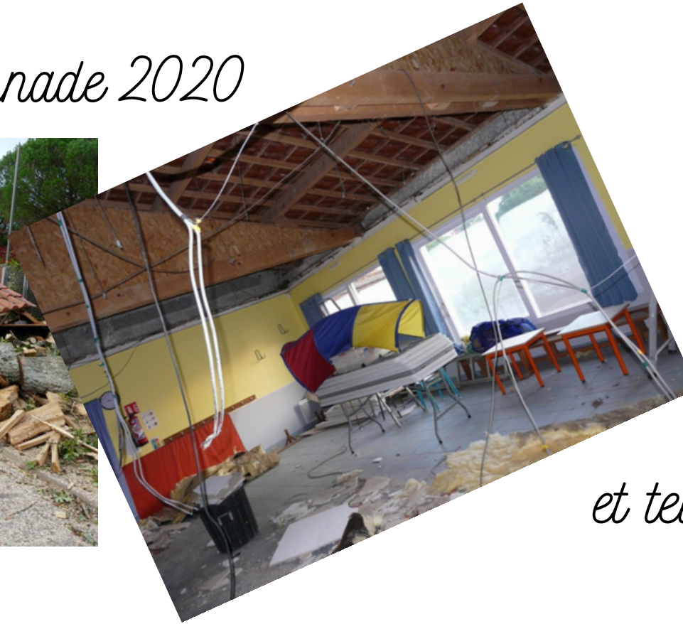
Clotures Portail Placards et tellement d'autres