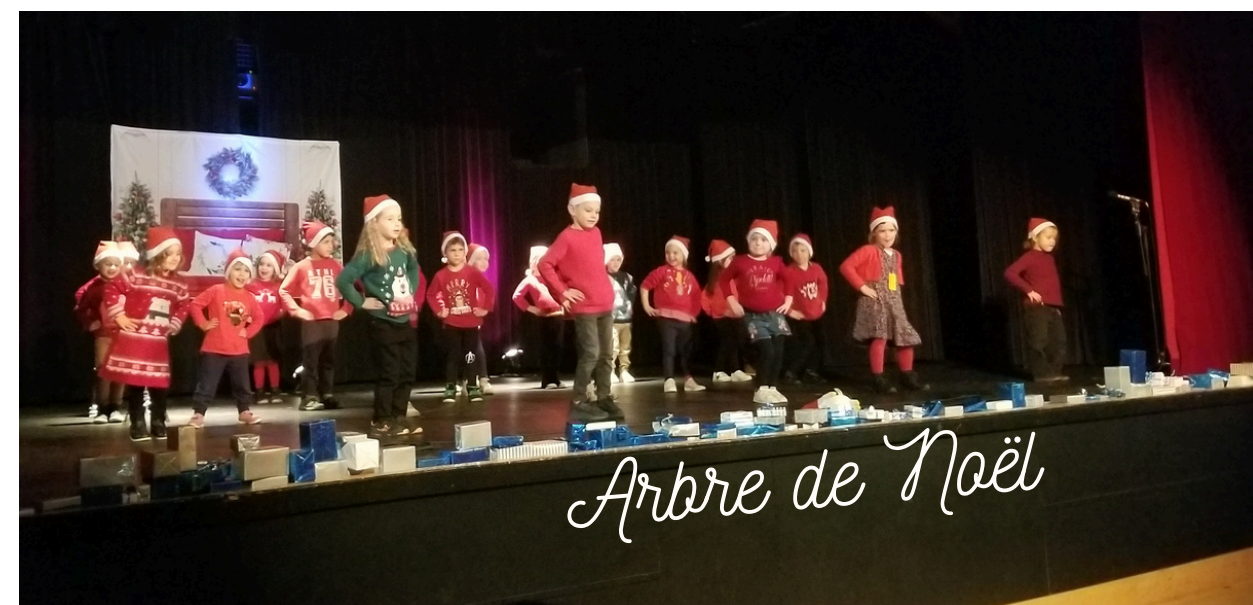
Arbre de Noël