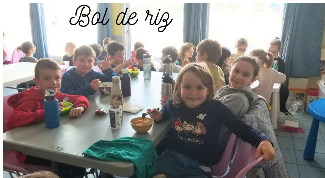
Bol de riz