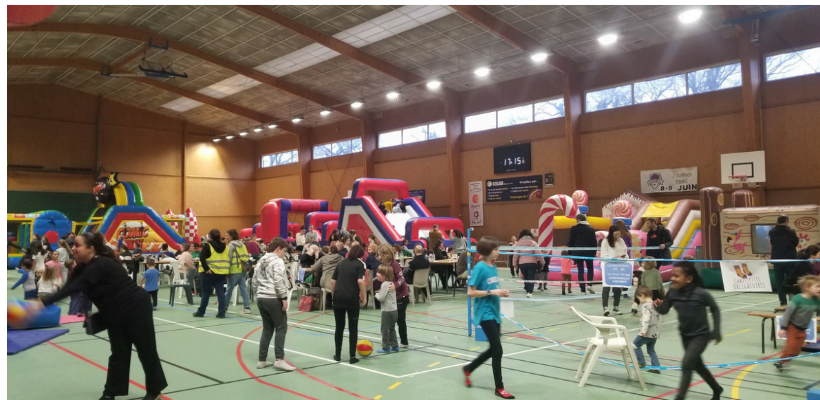
WE structures gonflables